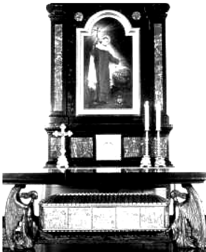
Oltář s ostatky sv. Rafaela v Czerné

Přes svoji aktivitu vynikal jako muž modlitby a spolubratři ho proto nazvali „chodící modlitbou“. V roce 1904 z rozhodnutí představených začal psát svůj životopis.